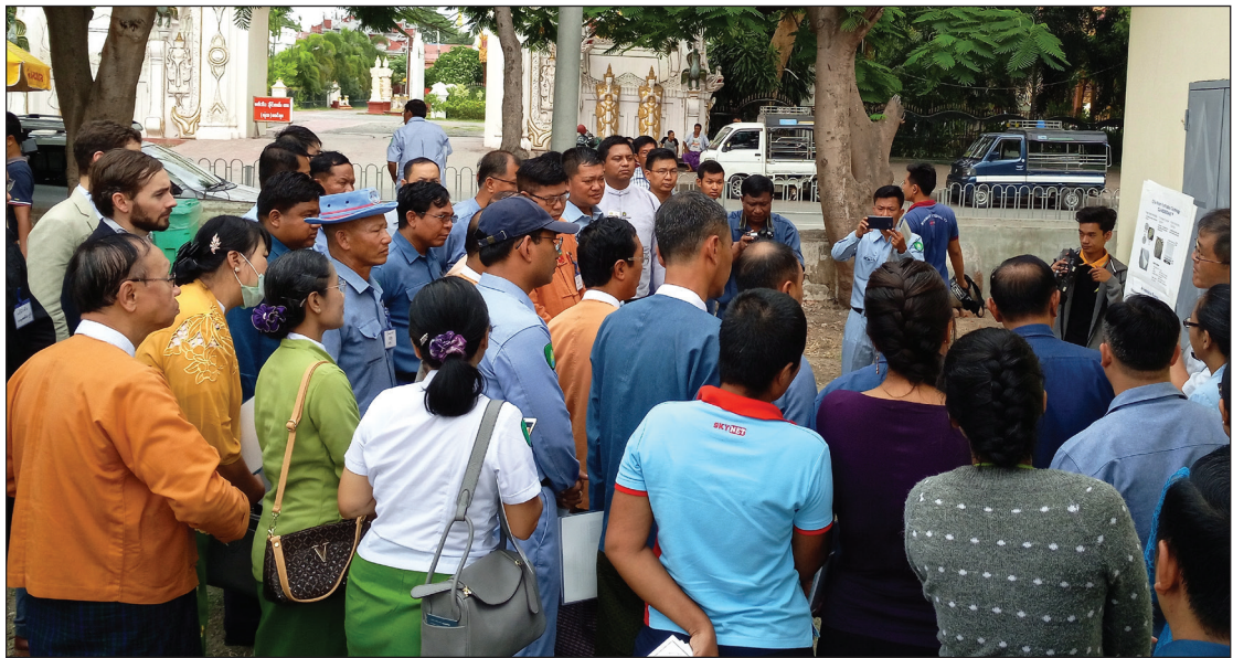
စည်ပင်အရာရှိများမန္တလေး စည်ပင်သာယာရေးဧကွန်းစက် သို့သွားရောက်ကြည့်ရှုစဉ်

အစိုးရသည် ညှိနှိုင်းတိုင်ပင်ခြင်းနှင့် ပွင့်လင်းမြင်သာခြင်း တို့တွင် ပါဝင်ရန်လိုအပ်ချက်များကို ဖန်တီးနိုင်သော်လည်း၊ အစိုးရတာဝန်ရှိသူများ၏ စီးပွားရေးလုပ်ငန်းများနှင့် နိုင်ငံ သားများအား ရိုးသားဖြောင့်မတ်စွာ တွေ့ဆုံပြောဆိုလိုသော ဆန္ဒရှိ/မရှိ အပေါ်မူတည်သည်။ ဥပမာအားဖြင့် ပြည်နယ်နှင့် တိုင်းဒေသကြီး အစိုးရ၏ လမ်းညွှန်ချက်များမှတစ်ဆင့် ညှိနှိုင်းတိုင်ပင်မှု အရေအတွက် တိုးမြှင့်ခြင်း သို့မဟုတ် အများပြည်သူအား အသိပေးနှိုးဆော်ခြင်းဆိုင်ရာ ကြော်ငြာ အသစ်မှတစ်ဆင့် လိုအပ်ချက်များကို ချမှတ်ခြင်း ပြုလုပ် နိုင်သည်။ ညှိနှိုင်းတိုင်ပင်ခြင်း၏ အရည်အသွေးတိုးတက်မှု လိုအပ်ချက်များ ပြဋ္ဌာန်းရန်မှာ ပို၍ပင်ခက်ခဲသည်။ အဓိပ္ပာယ်ပြည့်ဝသော တိုင်ပင်ဆွေးနွေးခြင်းသည် မြန်မာ နိုင်ငံတွင် ရလဒ်ကောင်းများနှင့် ခိုင်မာသောဆက်ဆံရေးများ ရရှိစေသည်။ တိုင်ပင်ညှိနှိုင်းမှုများသည် အခြား အရေး ကြီးသည့် သက်ရောက်မှုများကိုလည်း ဖြစ်ပေါ်စေနိုင်သည်။ ပို၍အင်အားကြီးသော အဆင့်များကို အသုံးမပြုမီ ညှိနှိုင်း တိုင်ပင်ခြင်းကို အရေးကြီးသော ခြေလှမ်းတစ်ခုအဖြစ် အရာရှိများက ရှုမြင်ကြသည်။ စည်းမျဉ်းများ လိုက်နာစေ ရန်ကိုလည်းကောင်း၊ မြှင့်တင်ရန်လည်းကောင်း အတင်း အကြပ်ပြုလုပ်ခြင်း သို့မဟုတ် ထိုကဲ့သို့သောအလားတူ အခြားရွေးချယ်စရာ နည်းလမ်းများကို ရှောင်ရှားရန် မျှော် လင့်ချက်ဖြင့် အရာရှိများသည် ပညာပေးနိုင်ရန်အတွက် အကြံဉာဏ်ကောင်းများ ရယူခြင်းကို အသုံးပြုကြပါသည်။ ၇၉