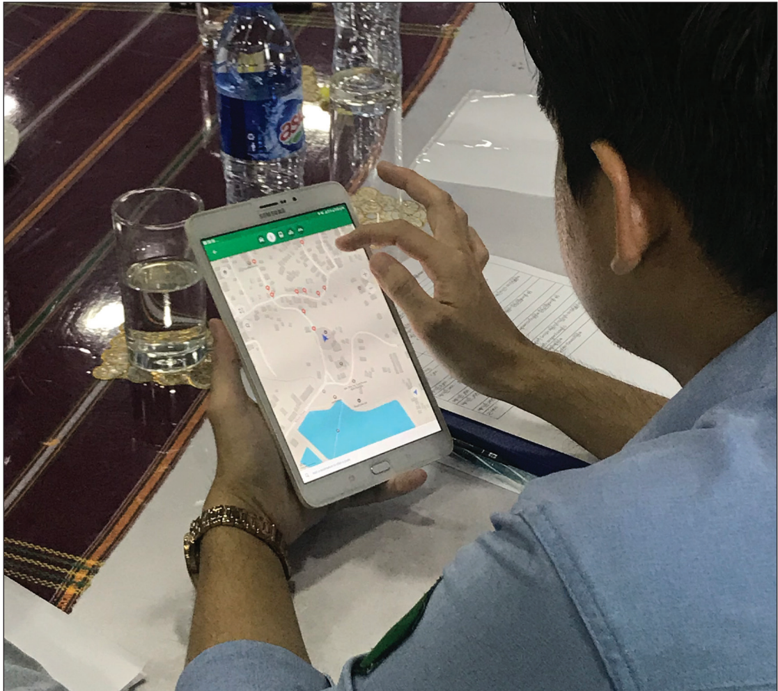
တည်နေရာပြအချက်အလက်များ ကောက်ယူရာတွင် မြေပုံအက်ပလီကေးရှင်းအား အသုံးပြုနေသည့် စည်ပင်သာယာရေးဝန်ထမ်း

ဒေသန္တရအစိုးရနှင့် အဆက်အသွယ်ပြုလုပ်ရာတွင် မြို့နယ်အဆင့်ပုဂ္ဂလိကကဏ္ဍ အဖွဲ့အစည်းများကို ကြားခံအဖြစ်အသုံးဝင်နိုင်စေရန် ၎င်းတို့ကို ခိုင်မာဖွံ့ဖြိုးတိုးတက်အောင်ပြုလုပ်ပါ။ ပုဂ္ဂလိကကဏ္ဍ အဖွဲ့အစည်းများသည် သတင်းအချက်အလက် ဖြန့်ဝေခြင်းကိုလွယ်ကူချောမွေ့စေပြီး ညှိနှိုင်းတိုင်ပင်ခြင်း သို့မဟုတ် သတင်းအချက်အလက် မျှဝေခြင်းများတွင် ပါဝင်လိုပါက အစိုးရအတွက် ဆက်သွယ်ရေးလမ်းကြောင်း တစ်ခုအဖြစ် ဆောင်ရွက်နိုင်သည်။ အထူးသဖြင့် မြို့နယ်အဆင့်တွင် ဤအဖွဲ့အစည်း များအား ပိုမိုဖွံ့ဖြိုးတိုးတက်စေခြင်းသည် စီးပွားရေးအုပ်ချုပ်စီမံမှု ရလဒ်များ တိုးတက်စေရန် အထောက်အကူပြုနိုင်သည်။ သေးငယ်သည့် စီးပွားရေးအသိုင်းအဝိုင်းများ ရှိသော မြို့နယ်များတွင် အဖွဲ့အစည်းများသည် ကျယ်ပြန့်သော အခြေပြုပြီး ကဏ္ဍစုံပါဝင်နိုင်သည်။ စီးပွားရေးလုပ်ငန်းများသည် ကိုယ်စားလှယ်များအားလုံး ပါဝင်နိုင်သော အဖွဲ့အစည်းများအတွက် ကြိုးပမ်းသင့်သည်။