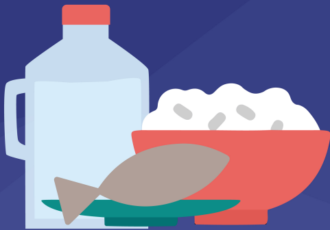
BARAK MÓS MAK GASTA OSAN NE'E BALUN BA

Maioria husi uma-kain sira informa katak sira gasta sira-nia osan ne'e hodis sosa hahán nu'udár prioridade urjente ida (25).