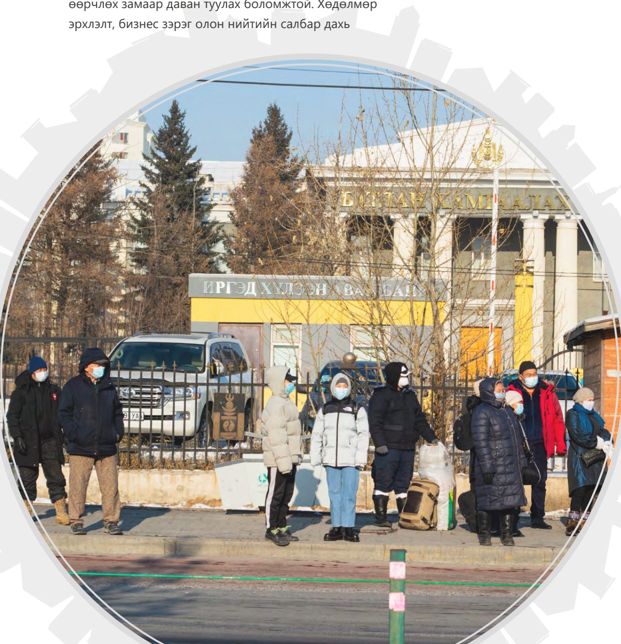
Монгол улс, Улаанбаатар хот, 2020 оны 12 дугаар сар.

Өсөн нэмэгдэж буй эд баялаг, нийгэм болон орон зайн тэгш бус байдлыг хөндөн, зогсоохгүй бол эдгээр нь нийгмийн хэлхээ холбоо, эдийн засгийн эргэн сэргэлтэд урт хугацаандаа сөргөөр нөлөөлнө. КОВИД-19 цар тахал болон болон хямралын нөлөөнд хамгийн ихээр өртөж, асуудлуудыг өөр дээрээ мэдэрсэн хүмүүсийг л ойлгож, тэдний хэрэгцээнд нийцсэн арга хэмжээг авч хэрэгжүүлснээр л цаашид тулгарах сорилтуудыг үр дүнтэй даван туулах бодлогыг боловсруулан гаргах боломжтой.