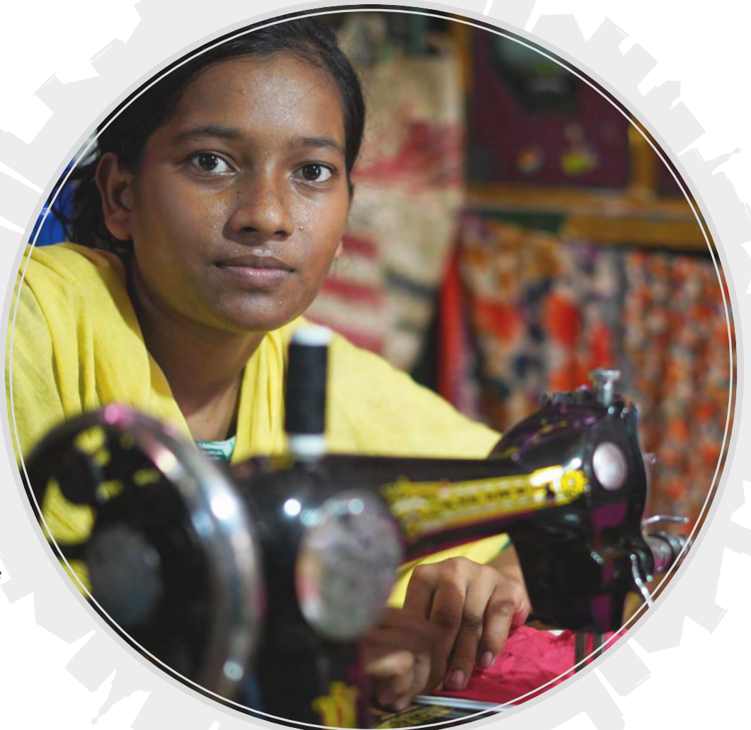
Жижиг бизнес эрхлэгч залуу эмэгтэй, Хулна, Бангладеш.