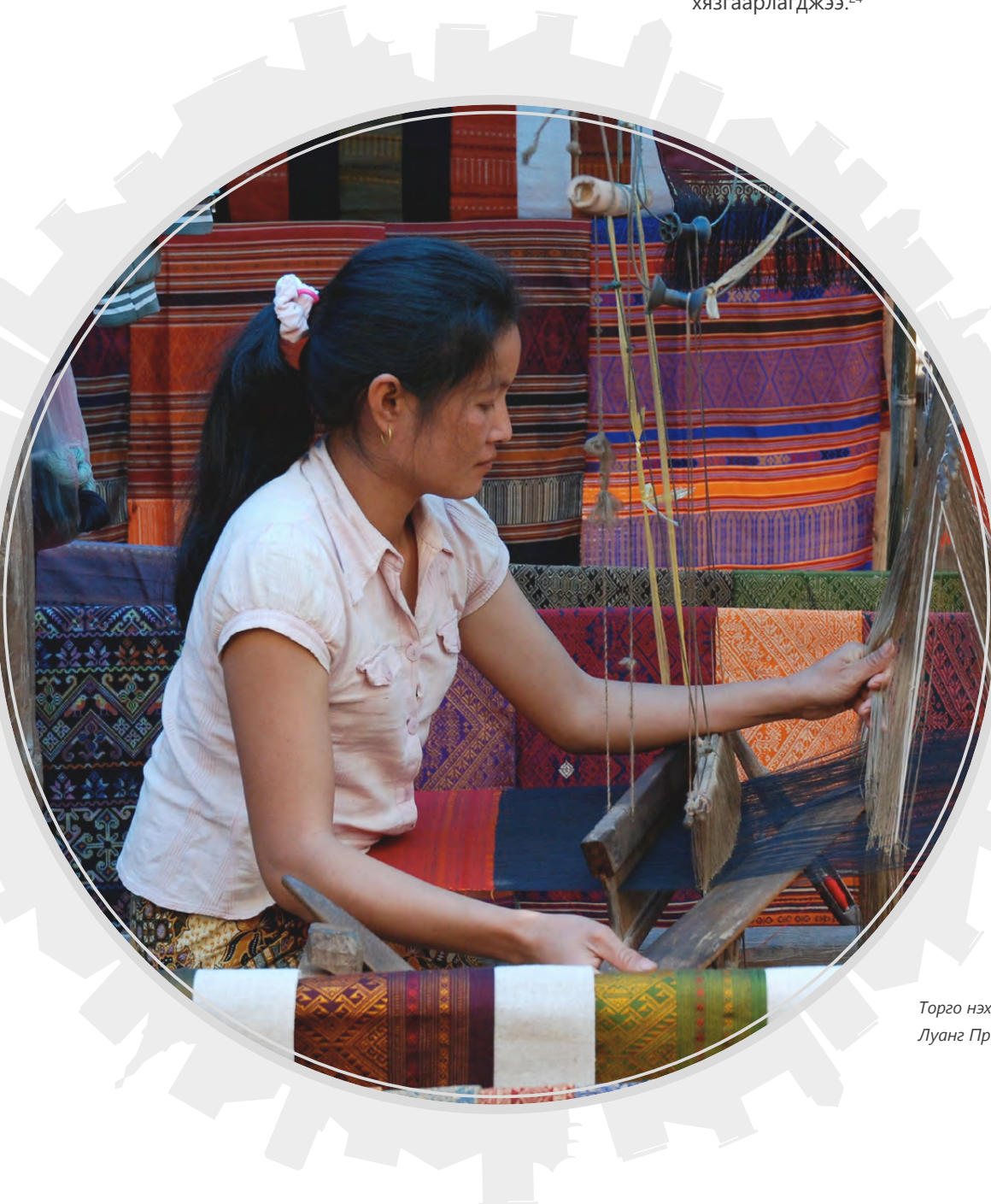
Торго нэхэж буй эмэгтэй. Лаос улс, Луанг Прабанг, Зургийг: Def-anan

Лаос улсын Засгийн газар нь цар тахлын үеэр өрхийн хэрэглээг дэмжих зорилгоор татвараас чөлөөлөх, татвар төлөх хугацааг хойшлуулах зэрэг арга хэмжээг хэрэгжүүлжээ. Энэхүү арга хэмжээний хүрээнд сар тутам 5 сая кипээс (550 ам.доллар) доогуур орлого бүхий өрхүүдийг орлогын албан татвараас чөлөөлсөн. Засгийн газраас мөн цахилгаан, ус, хог хаягдал, интернэтийн төлбөрийг гурван сарын хугацаанд чөлөөлж, импортын тарифыг тэглэжээ. Түүнчлэн арга хэмжээний хүрээнд жижиг, дунд бизнесийн салбарыг санхүүжүүлэх зорилгоор зээл олгожээ. Хувь хүн, өрхүүдэд олгосон шууд дэмжлэг нь маск болон гар ариутгагч зэрэг хамгаалах хэрэгсэл тараахаар л хязгаарлагджээ. 24