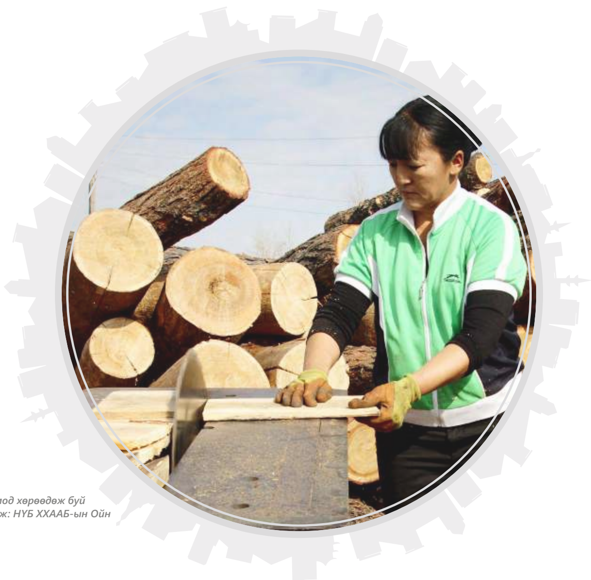
Суурин хөрөөгөөр мод хөрөөдөж буй эмэгтэй

(Нислэгийн тийз борлуулах агентлагийн ажилтан асан эмэгтэй)