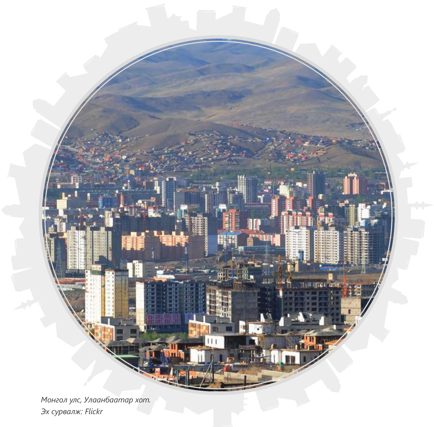
Монгол улс, Улаанбаатар хот.

мэдээлэл нь зөрүүтэй байсан, (2) албан бус салбарыг дэмжих бодлого дутмаг байсан асуудлууд байна. 19 Түүнчлэн хөдөлмөр эрхлэх боломж, эдийн засгийн эмзэг байдлын хувьд эмэгтэйчүүд, ялангуяа жижиг бизнесийн салбарт ажилладаг эмэгтэйчүүдийн хувьд үйл ойшоох, орхигдох нөхцөл байдлыг ихээр мэдэрчээ. 20