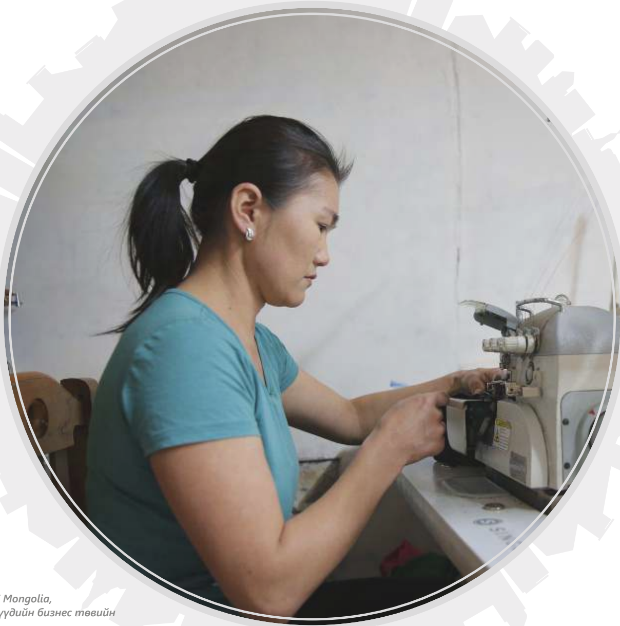
Фото: TAF Mongolia, Эмэгтэйчүүдийн бизнес төвийн төсөл

хойшлуулжээ. Өөр нэг оролцогч эмэгтэйн ажил олгогч нь сургалтын төлбөрийг нь төлөхөөр амласан байсан ч цар тахлаас үүдэн хойшлуулж, одоо ч энэ боломж бүрэн бүрдээгүй байна.